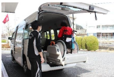
お楽しみ外出をしています