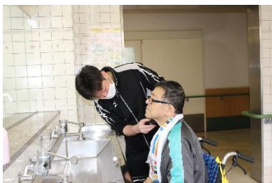
職員と共に身支度を整えます